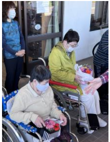
★北小学校の生徒さんより フラワーボックスプレゼント★