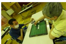
★オセロ大会の様子★