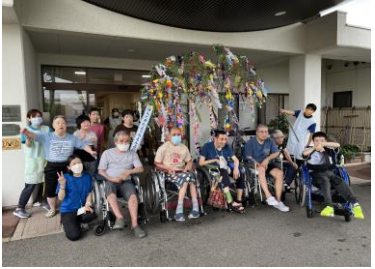
★七夕飾り 北幼稚園の皆様より★