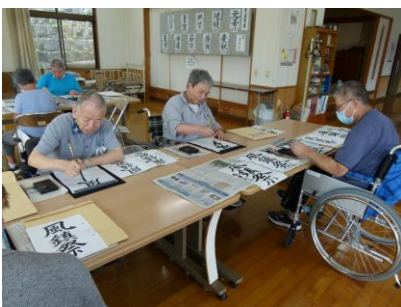
皆様、真剣に書かれていますね。