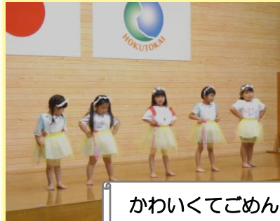
かわいくてごめん