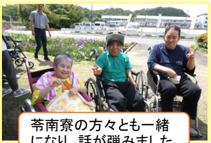
荅南寮の方々とも一緒 になり、話が弾みました。

5月29日から、楠浦町の花菖蒲園までのドライブを実施しました。 暑くて汗ばむこともありましたが、天気にも恵まれ、満開の花菖蒲を見ることができました。