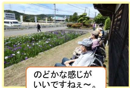
のどかな感じが いいですねえ～。