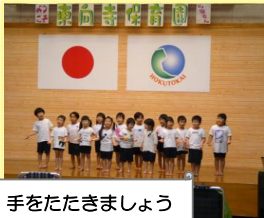
手をたたきましょう