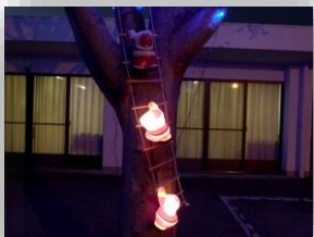
17時から21時まで点灯して います。