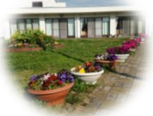
一棟園庭の花壇も満開で、とても綺麗でした!!!