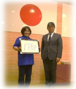
職員の表彰もありました。