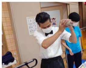
行列できてました!!!