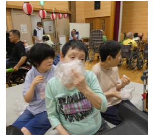
みなさん、おいしそうですね^^