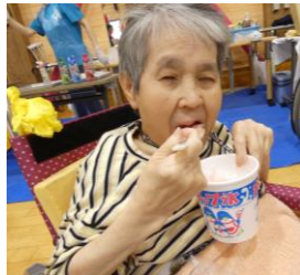
当日限定開店！？ Takeshi's Bar