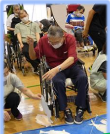
第一競技 釣り名人