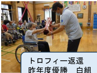
トロフィー返還 昨年度優勝 白組