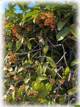
星光園の金木屋も満開でした。