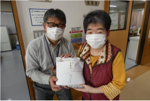
皆様 お疲れさまでした☆