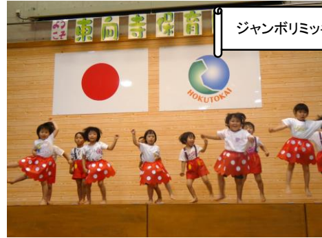
ジャンボリミッキー