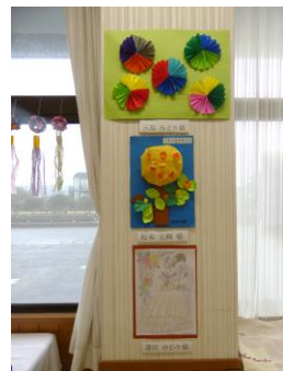
利用者様による作品展示