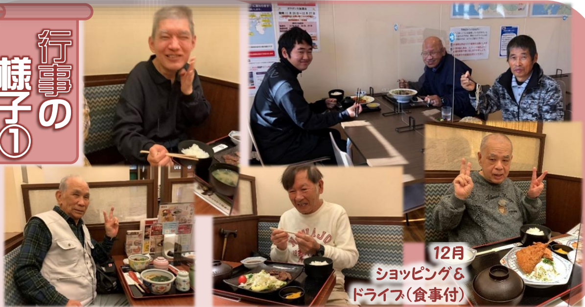
12月 ショッピング& ドライブ(食事付)